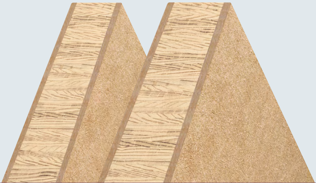
Moralt LAMINESSE FireSmoke MDF (44 mm)