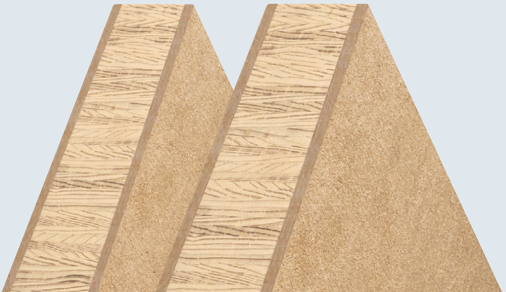
Moralt LAMINESSE FireSmoke MDF (44 mm)